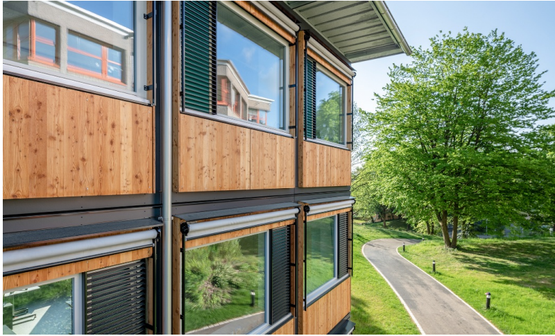
Holzfassade des modularen Schulhauspavillons