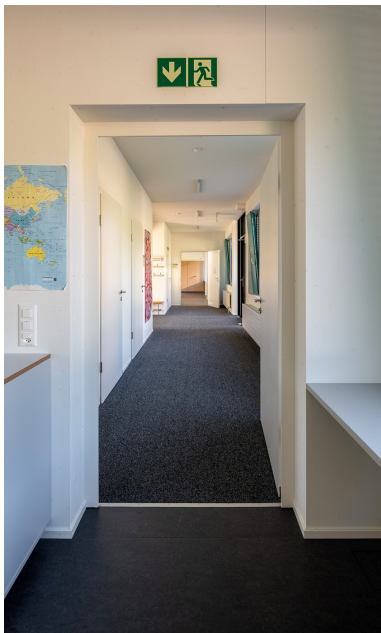
Schulhausgang im ZM10-Pavillon