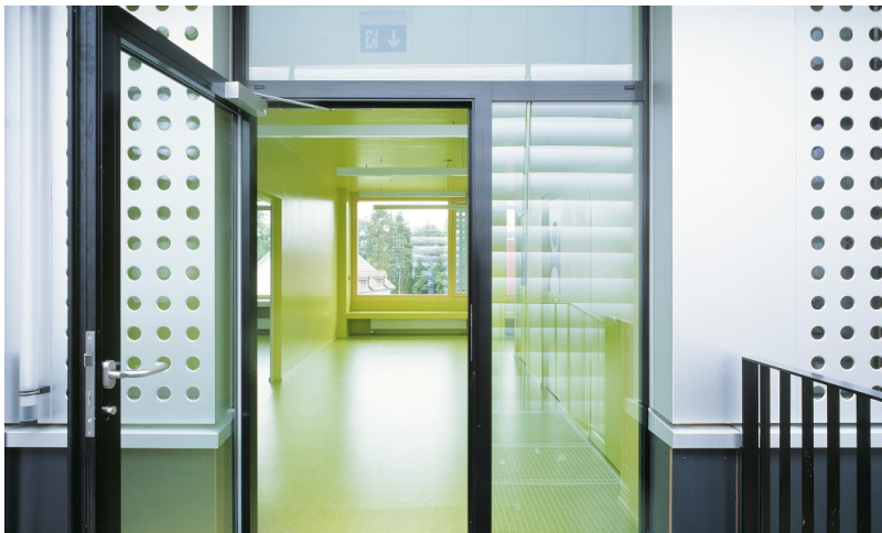
Grosszügiger Eingangsbereich im provisorischen Schulhaus