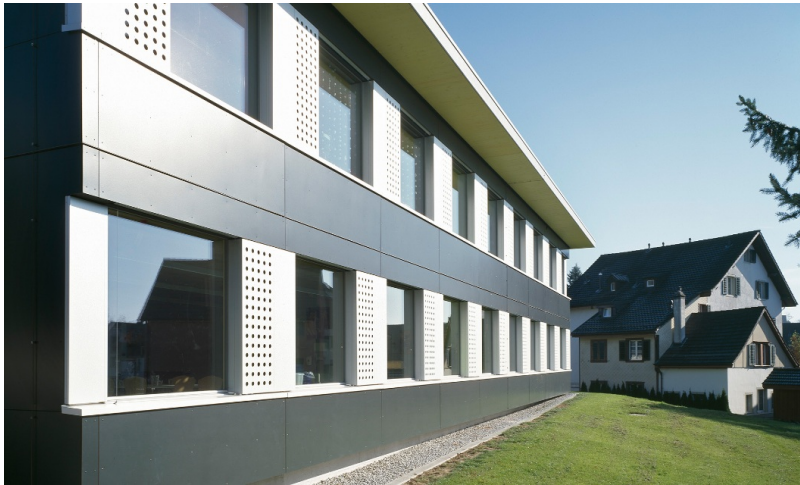
Temporäre Schulhaus-Modulbau Hasenacker mit Fassade in Anthrazit- Weiss