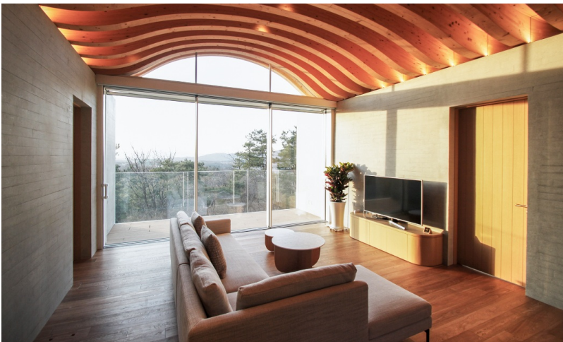
Stilvoller Innenausbau und geschmackvoll eingerichtet: Suite im Condo A.