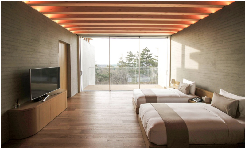
Elegantes Schlafzimmer im Condo-A- Apartmenthaus