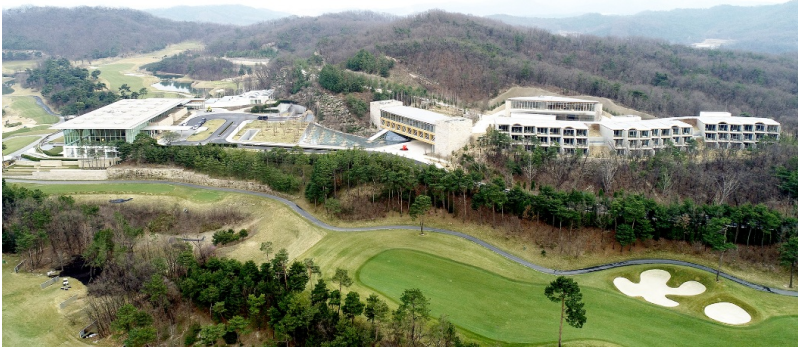
Alle neuen Gebäude des Haesley Nine Bridges Golfklubs im Überblick.