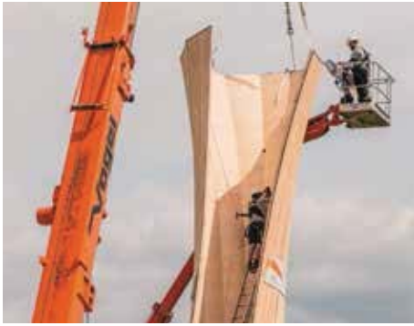
Spezialisten von Blumer-Lehmann AG montieren in luftiger Höhe die fertigen Turmelemente.

kommende neue Beschichtung verhindern. Zudem: Die Lärchenholzfassade erhält mit der Zeit eine gleichmässige weisse Farbe, die bereits heute kurz vor dem Ende der Gartenschau ersichtlich ist.